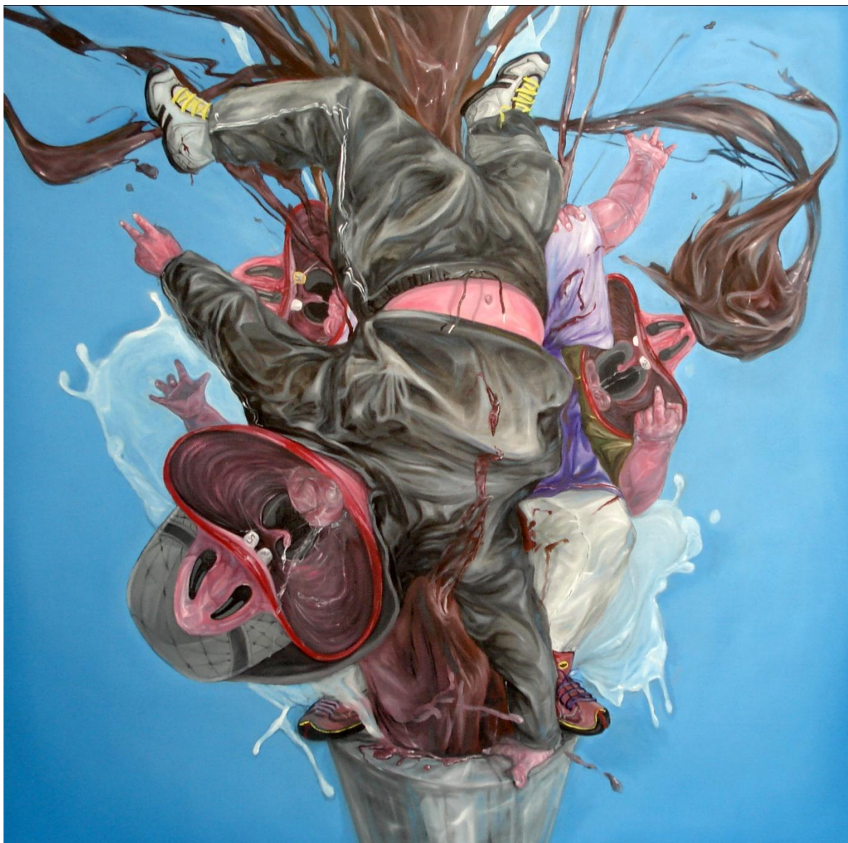
Chocolate factory , huile sur toile, 120x120cm, 2010