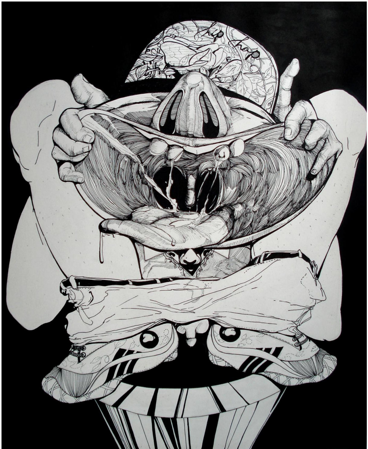
I love serious people , Encre sur papier, 44x56cm, 2010