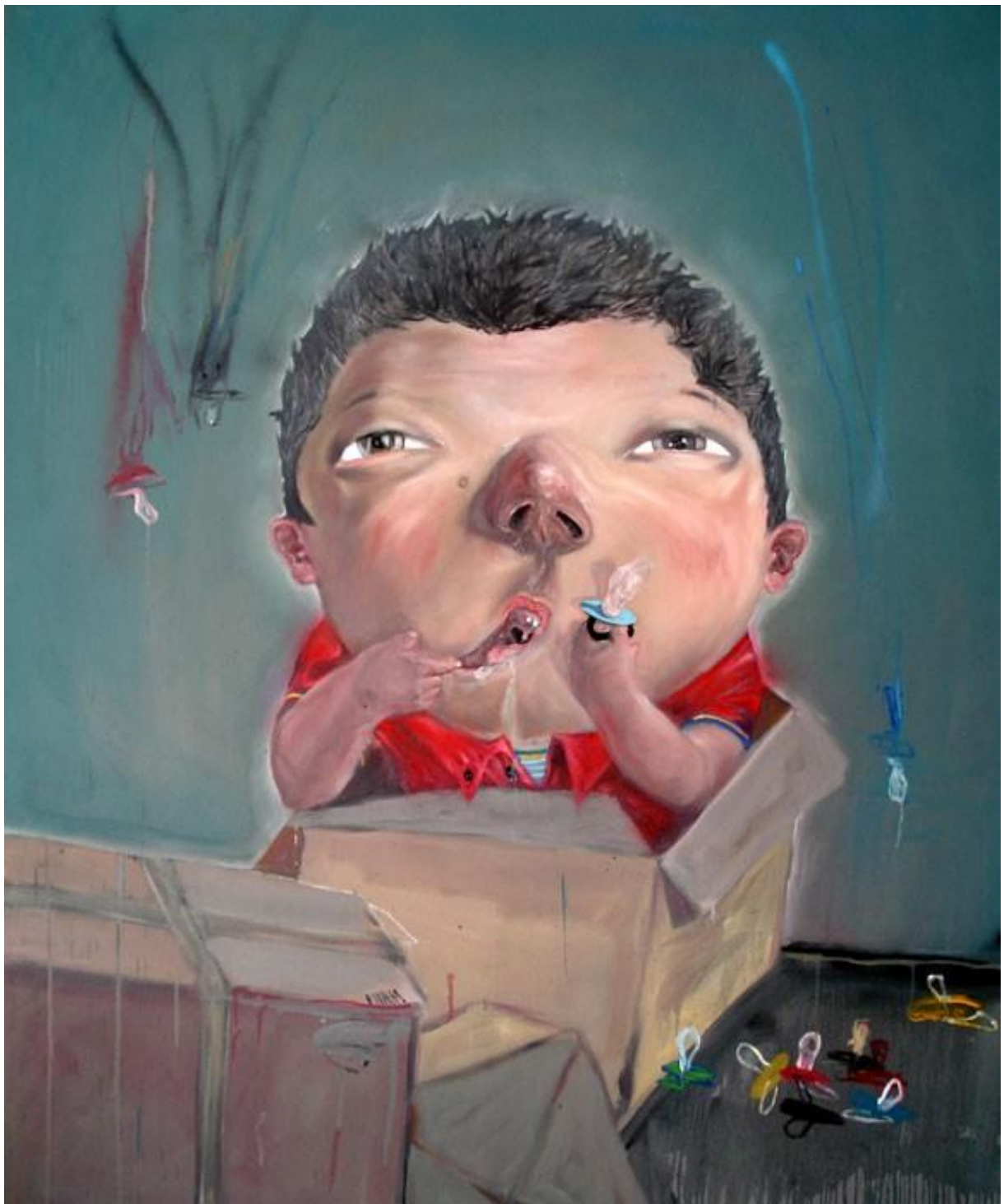
Ma mère me manque , huile sur toile, 180x150cm, 2009