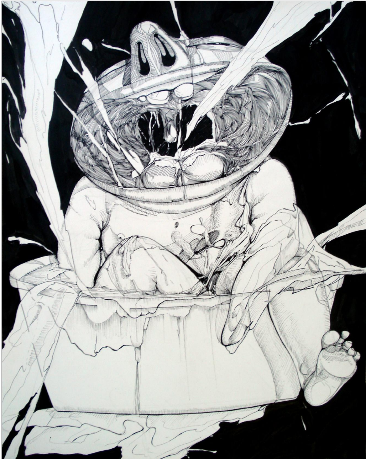
Je suis sensible , Encre sur papier, 44x56cm, 2009