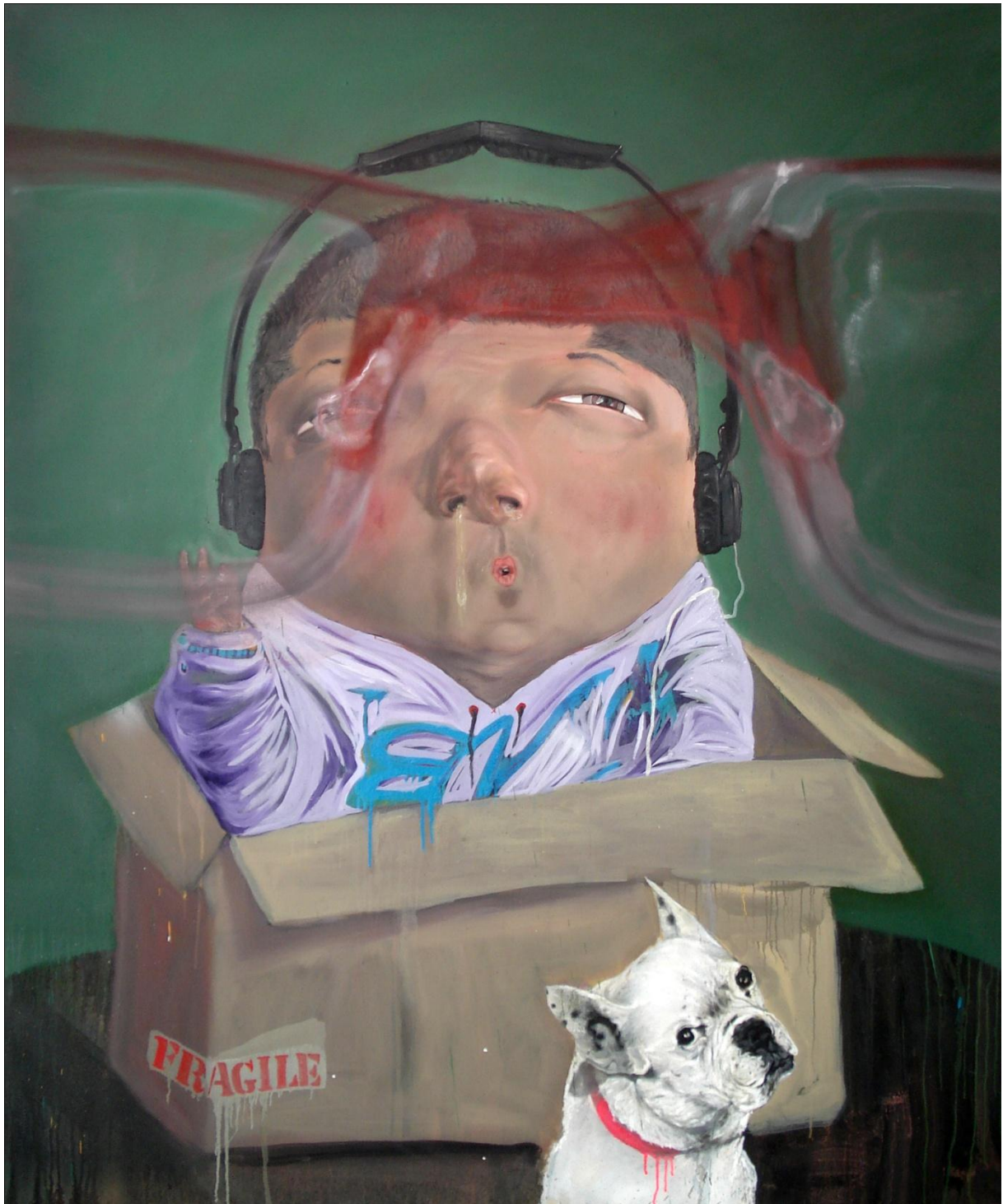
There is too much noise, huile sur toile, 180x150cm, 2009