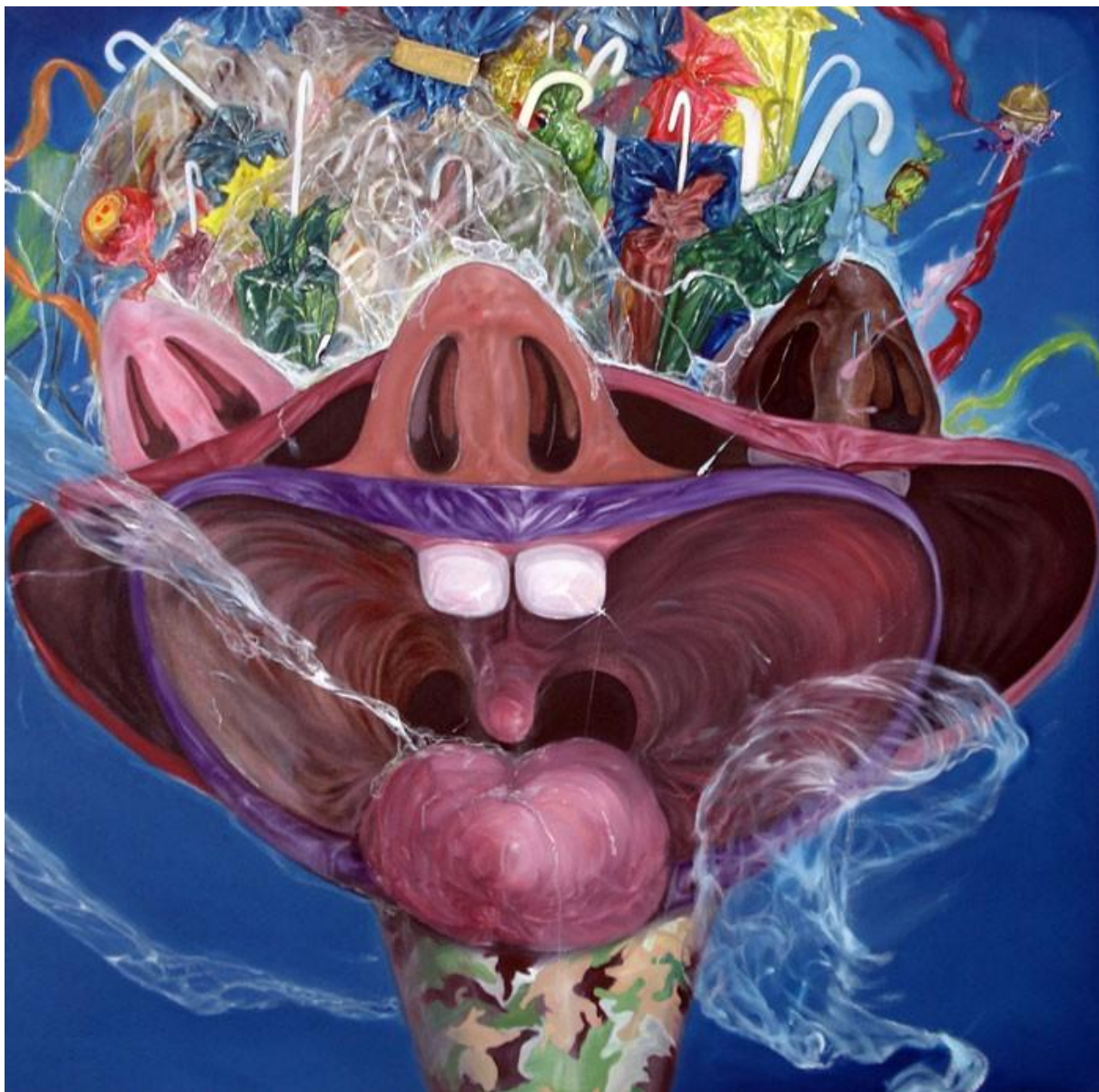
Bonbons el Eid , huile sur toile, 120x120cm, 2010