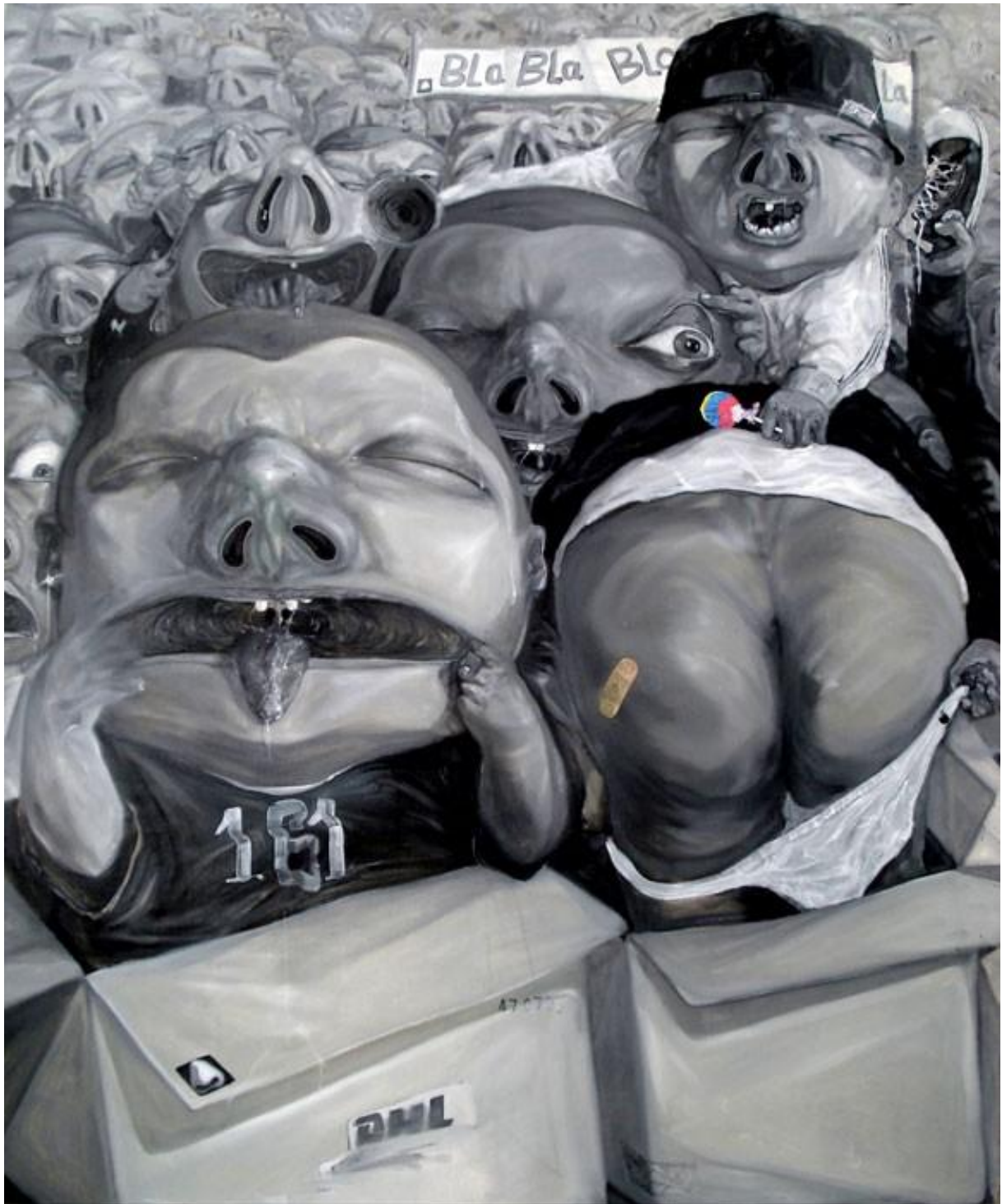
Bla bla bla , huile sur toile, 180x150cm, 2009