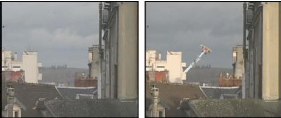
Lin Jin-Man, Mirage #1, vidéo, couleur, sonore, 2 mn 10'', 2006.

«Mirage #1» a été réalisée pendant une fête foraine à Limoges. La ville étant déjà quelque chose d'étrange par rapport à la nature, elle est pour moi un mirage. La fête foraine, quant à elle, est comme un mirage dans la ville, un endroit éphémère qui nous permet de quitter notre vie habituelle et nous transporte au-delà du réel. Cette vidéo fait partie d'une trilogie intitulée «Mirages» qui tente de transcender l'état des habitants dans les villes modernes, en extrayant la peur de la joie, et l'étrangeté de l'habitus.