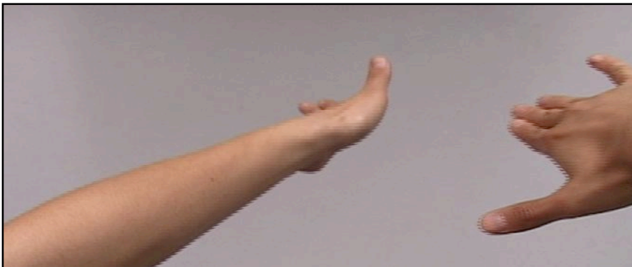
Wu Chien-Ying, Combat aérien, vidéo, 16/9, couleur, sonore, 2 mn, 2009.

«Mirage #1» a été réalisée pendant une fête foraine à Limoges. La ville étant déjà quelque chose d'étrange par rapport à la nature, elle est pour moi un mirage. La fête foraine, quant à elle, est comme un mirage dans la ville, un endroit éphémère qui nous permet de quitter notre vie habituelle et nous transporte au-delà du réel. Cette vidéo fait partie d'une trilogie intitulée «Mirages» qui tente de transcender l'état des habitants dans les villes modernes, en extrayant la peur de la joie, et l'étrangeté de l'habitus.